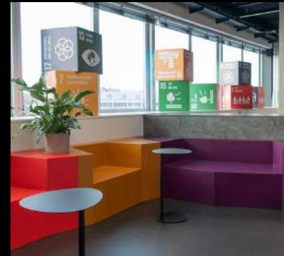
Quinze & Milan